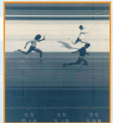
1985年黎sir (上白衣)力壓學生隊 勇奪 4X100 師生接力賽冠軍