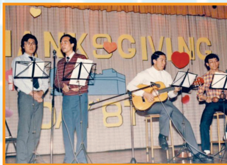
1987年感恩節晚會神長老師合唱表演