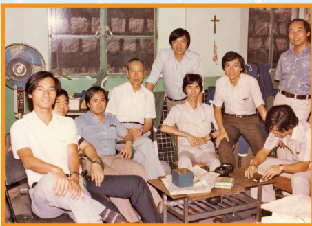
1981年與部份同事在406 教員室合照