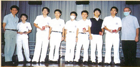
校際網球第二組 團體亞軍