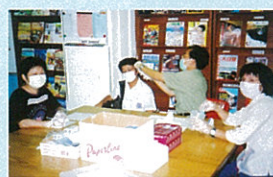
家長協助填寫體溫表及消毒