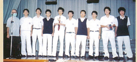
校際籃球第三組 乙組亞軍