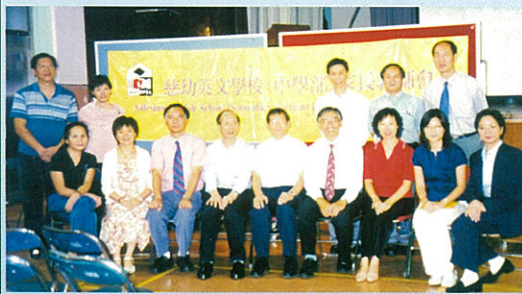
2002年 - 2003年度 家長教師會委員合照