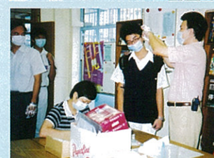
老師為學生量度體溫