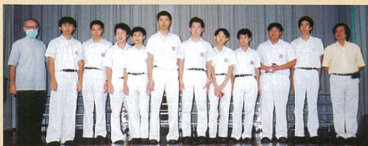
校際乒乓球第二組 團體亞軍