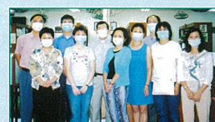
家長義工與校長及老師合照 你猜他們是誰？