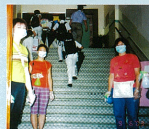
家長協助學生噴上消毒火酒