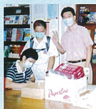
學生體溫正常OK過關