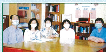
會訊編輯小組與老師合照 你認識他們嗎？