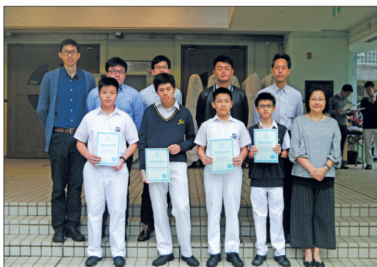
創意解難比賽 主辦機構：EDB