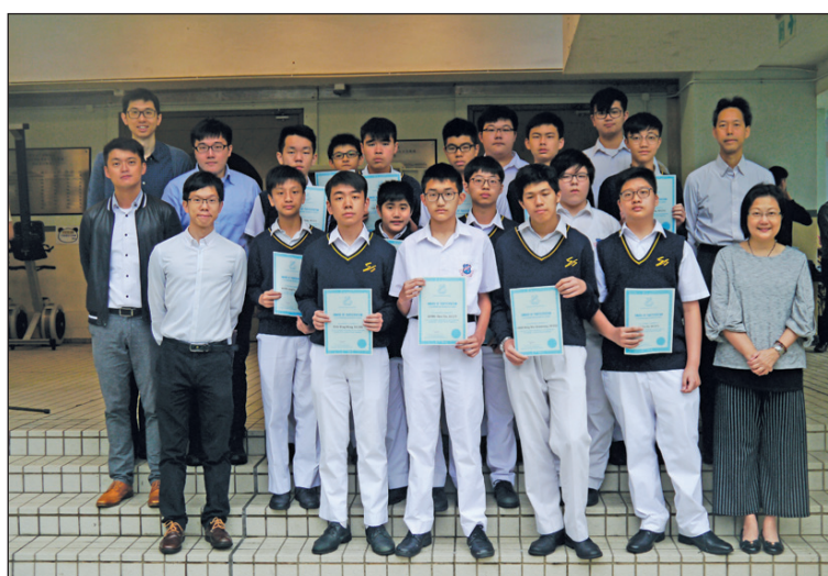
大灣盃選拔賽 主辦機構：奧冠教育中心