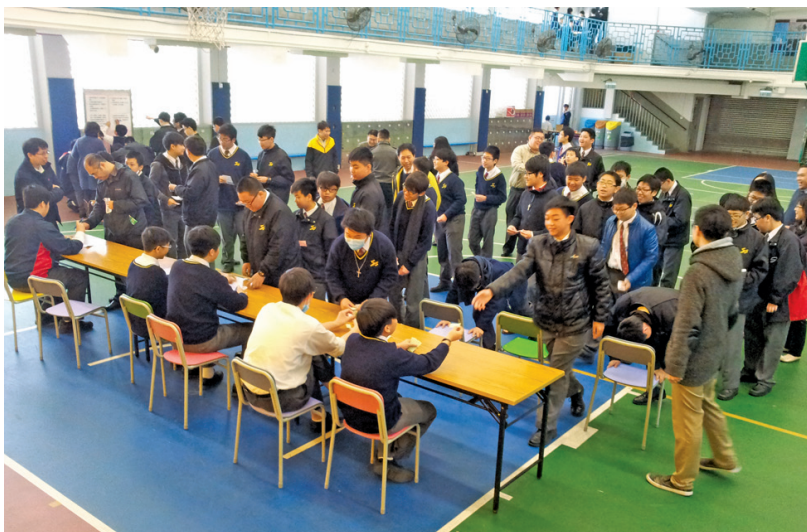
同學們踴躍參與宗教週中的貧富午餐活動

十二月五日，本校慶祝無原罪聖母瞻禮。是次瞻禮主題是「效法聖母，與青年同行」。當日早上，教友、慕道同學及善會會員偕同教友老師於禮堂參與感恩祭，由梁定國神父主祭。其他老師及同學則於大操場參與聖經誦禱，由葉泰浩神父主禮，並由梁保得修生証道。感恩祭及聖經誦禱過後同學們一邊享受瞻禮小食，一邊參與餘慶節目，包括：電影欣賞、棋類比賽等。