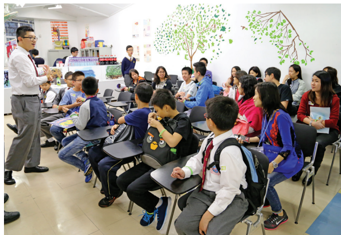
推廣日《English Cafe》中同學與來賓交流如何才能吃得健康