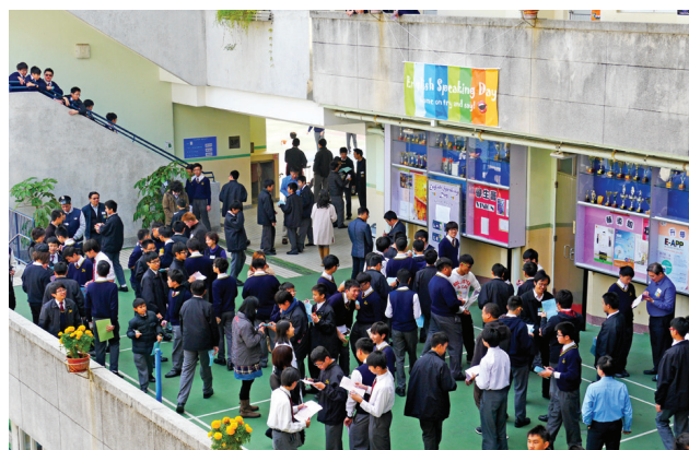
全校同學一起參與English Speaking Day，熱鬧非常。