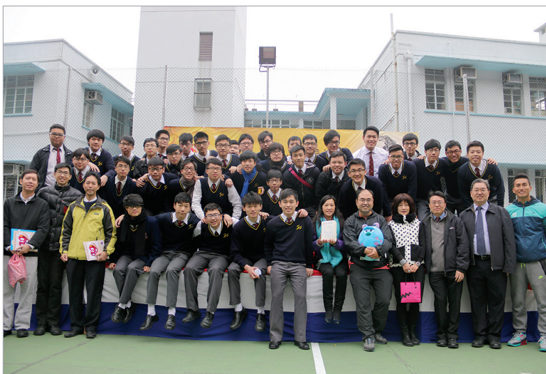
同學藉著一年一度的《感恩節》向老師表達謝意，場面溫馨。