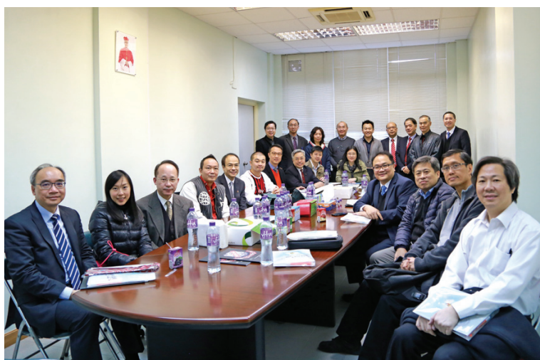
十多位慈幼大師兄在多元學習活動日蒞臨母校，為中六及中四的同學介紹各行各業的工作情況，令他們規劃好自己的將來。