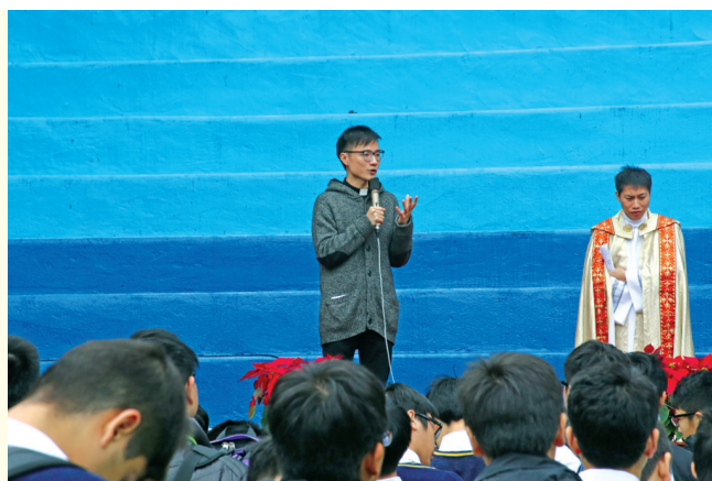
梁保得修生於聖母無原罪瞻禮聖經誦讀禮儀中証道