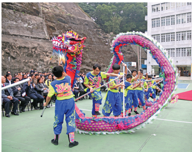
《感恩節》中，國術組同學為大家表演了一場非常精彩的舞龍。