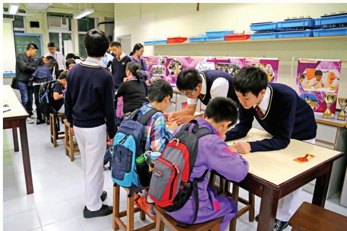
推廣日《奇趣數理天地》中同學指導參加者製作微型機械人