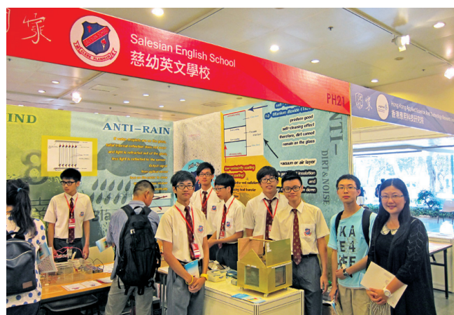
負責同學與杜校長合照