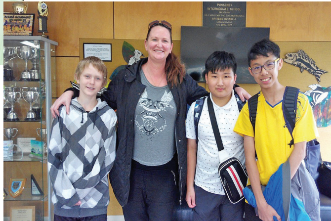
A good memory with native teacher and classmate.