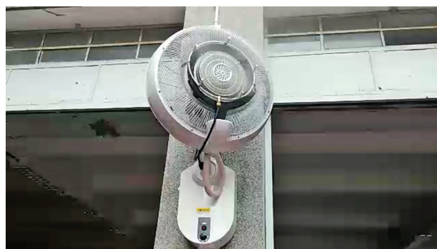
機波場的室外降溫噴霧風扇