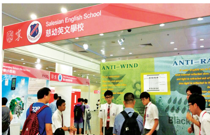
同學正向嘉賓介紹我們的參賽作品「五行窗」

八月二十二日至二十六日我校參加了第四十七屆聯校科學展覽。與二十多間入圍的參賽學校，在中央圖書館展覽廳舉行科學展覽。為配合大會「家」的主題，我校以「五行窗」為參賽作品，學生設計了一個具有防風，防雨、防污、隔聲和隔熱功能的窗戶，藉此令家居環境更加舒適和安全。同學有創意的設計和積極認真的態度，獲得不少到場參觀人士的讚賞。