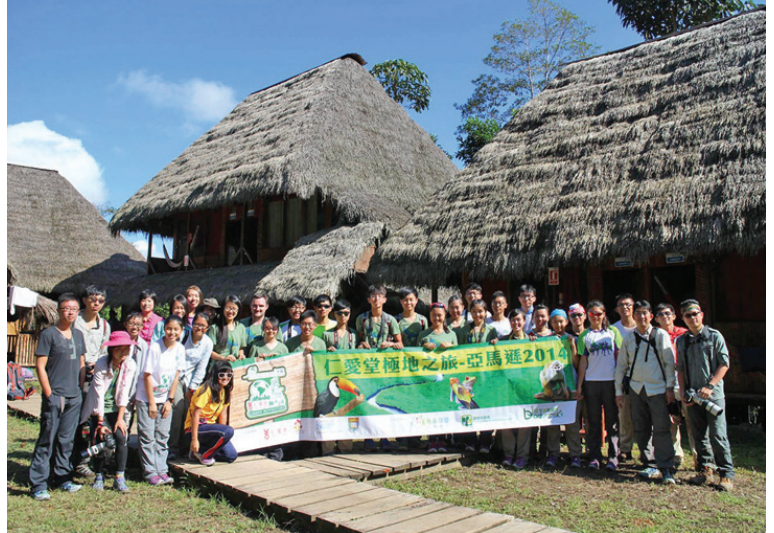
10-day conservation field trip in Amazon.