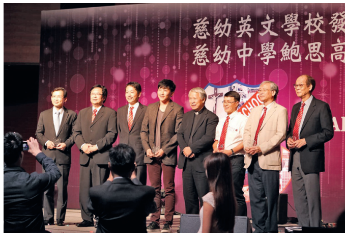
致送紀念品給各捐款同學