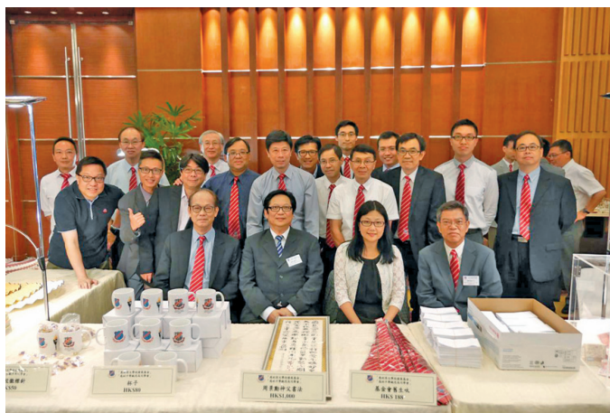
籌款晚宴部分籌委會成員及工作人員