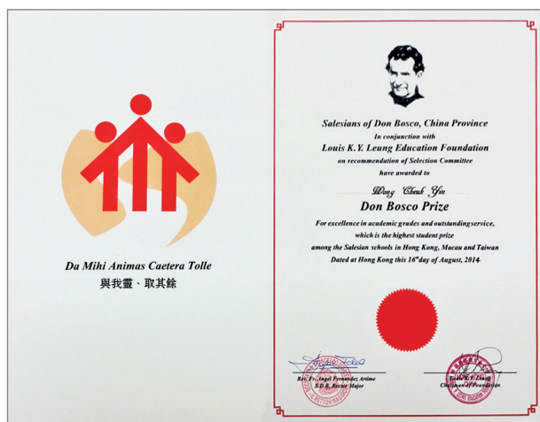
「聖鮑思高神父獎」獎狀