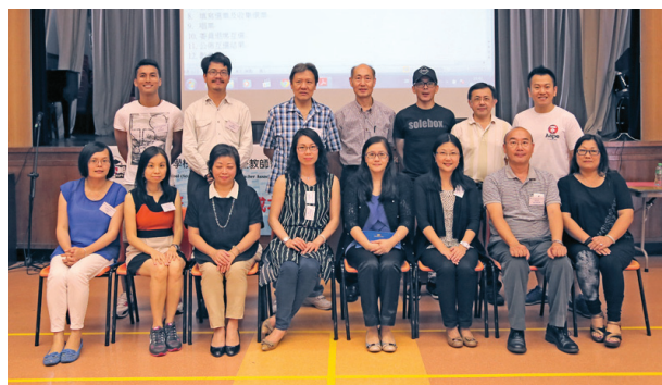
家長教師會第十五屆常務委員會