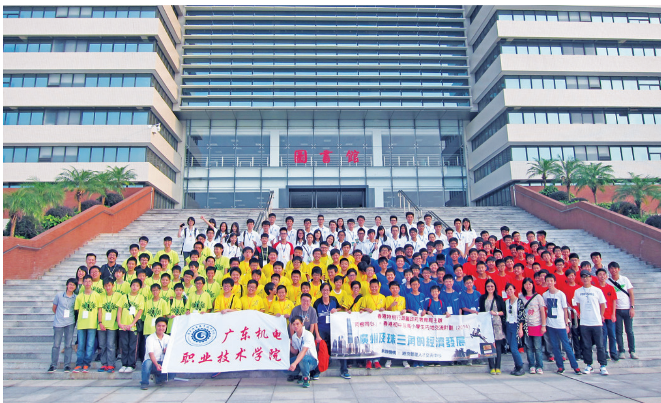
中二級同學前往廣州廣東機電職業技術學院