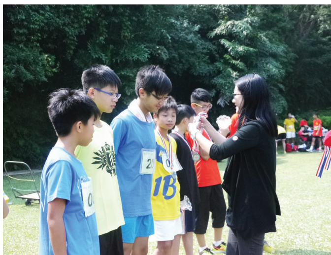
杜校長為勝出同學頒獎