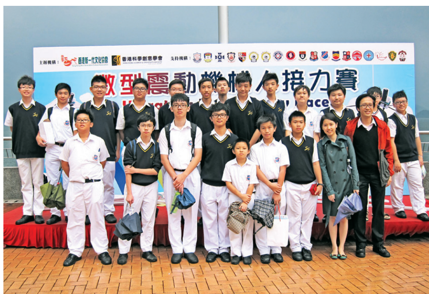
微型震動機械人接力賽