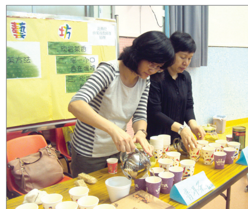
龍情午間派對中家長為我們調製美味的中國茶