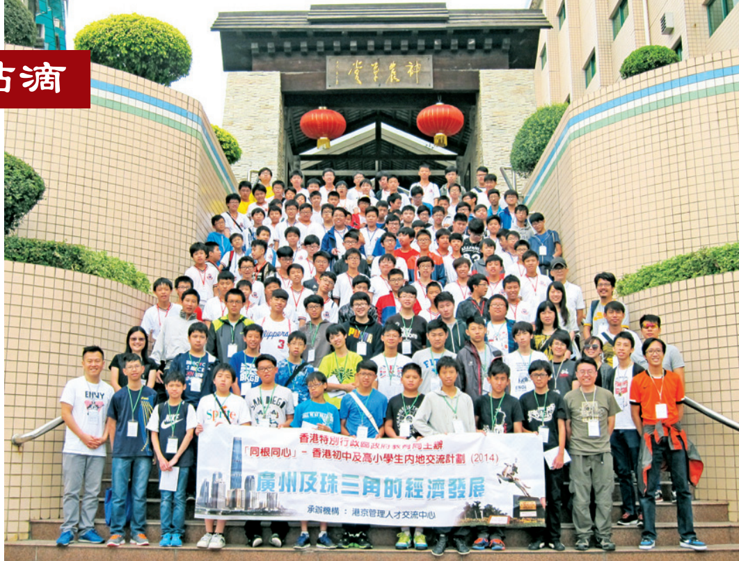
中二級同學前往廣州中藥園