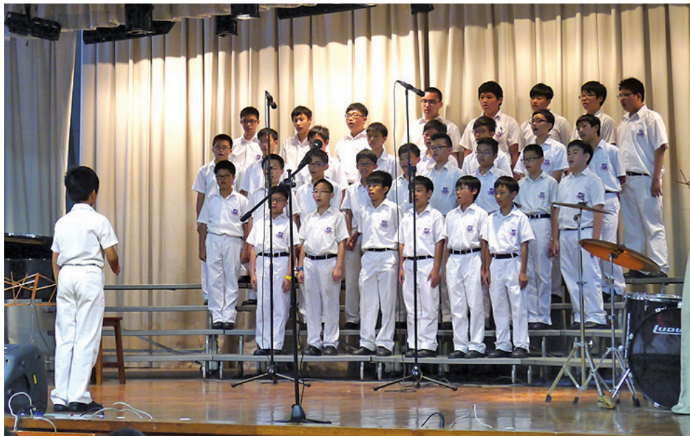
同學的歌聲繞樑三日！