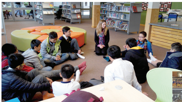
The students learnt a lot through sharing during the trip.

All in all, the tour was a fascinating one. According to our students' comments, they all liked the trip a lot. Despite of being alone for 16 days, which means they had to get used to unfamiliarities, they all enjoyed the time so much.