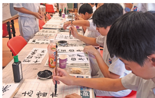
同學在龍情午間派對中即席揮毫